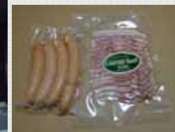
「ウイナーとベーコン」